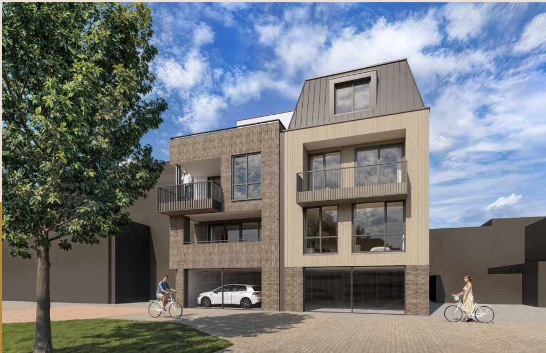
Aanzicht van de achtergevel.